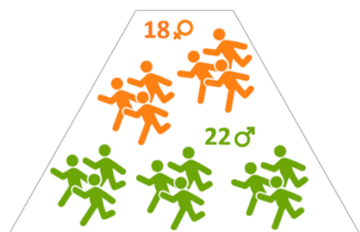
40 ATHLETES AU PROGRAMME QUARTZ