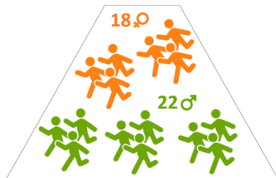
40 ATLETAS EN EL PROGRAMA QUARTZ

En 2018, 40 atletas elite han participado en el Programa QUARTZ Elite y 26 de ellos han hecho su perfil público . Este seguimiento anual personalizado, ha permitido identificar perfiles potencialmente problemáticos en términos de salud, acompañar a los elite realizando análisis específicos informando sobre los riesgos ligados a ciertos medicamentos y complementos alimentarios.